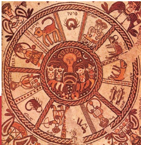
Mosaikboden in der Synagoge von Beit Alfa mit einer Sternzeichendarstellung Mosaic floor in the Beit Alfa Synagogue depicting the signs of the zodiac

Wie sind die historischen Ursprünge, Bedingungen, Entwicklungen und Wirkungen der Anwendung von Gesetzesterminologie bzw. -metaphorik auf die Deutung kosmischer Phänomene zu bestimmen? Die internationale Tagung will einerseits die bislang vorherrschende Position in der Wissenschaftsgeschichte korrigieren, die Vorstellung von «Naturgesetzen» sei erstmals im antiken Griechenland entwickelt worden. Andererseits möchte sie zu einem umfassenderen und differenzierteren Verständnis der Rede von «Naturgesetzen» in ihren historischen Entstehungskontexten gelangen und so die Vielgestaltigkeit der Interpretation regelhafter Prozesse in der Natur in der antiken Welt aufzeigen. Die Beiträge der Tagung stammen von Vertreterinnen und Vertretern der Assyriologie, Bibelwissenschaft, Klassischen Philologie, Religionswissenschaft, Ägyptologie und Physik aus den Vereinigten Staaten, Europa und Israel.